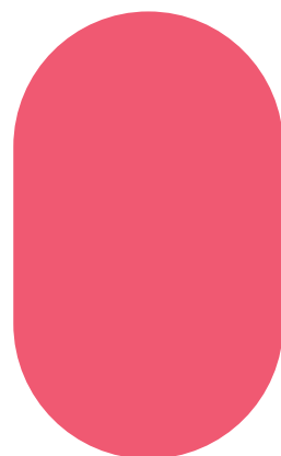
Rose Couleur n° 2