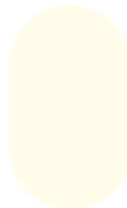
Beige Couleur n° 2